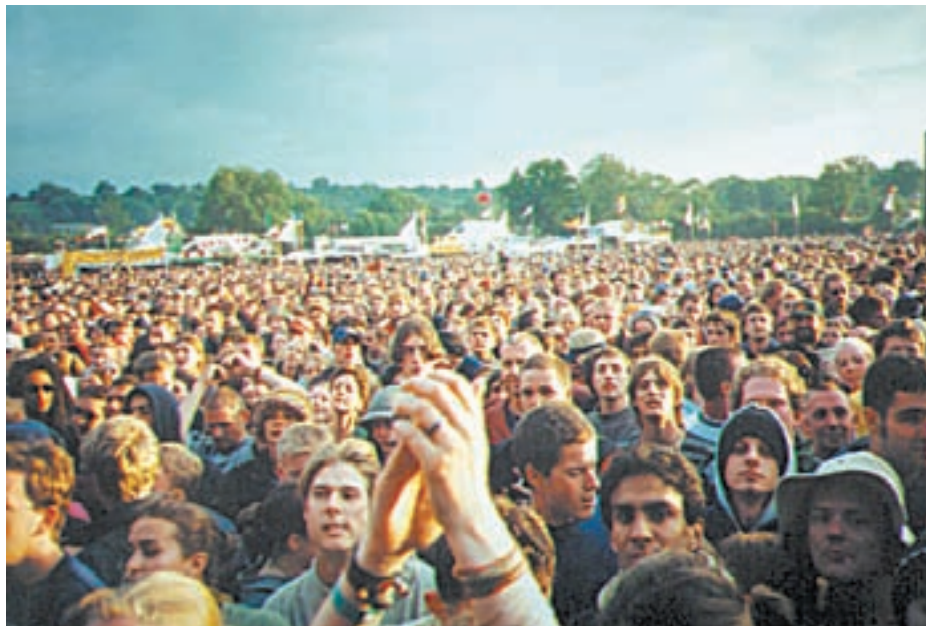
ΠΟΣΟΙ ΚΑΙ ΠΟΙΟΙ ΠΟΛΙΤΙΚΟΙ ΒΡΕΘΗΚΑΝ ΠΟΤΕ ΣΕ ΤΕΤΟΙΕΣ ΣΥΝΑΥΛΙΕΣ;

Η γενική εικόνα που μου έρχεται στο μυαλό στον τομέα «πολιτικοί και μουσική» είναι τσάμικα, καλαματιανά, ζειμπέκικα για να κλαίνε και οι ρέγκες, μπουζούκια που ακολουθούνται από δηλώσεις ενθουσιασμού, αφορισμοί του (συχωρεμένου) Γιαννόπουλου περί κέντρων πολιτισμού. Θα μου πεις, τι να κάνουν οι άνθρωποι, ο πελάτης έχει πάντα δικίο και ο πολιτικός θα βρεθεί στη φάση που θα πρέπει να σύρει και τον καλαματιανό, να σιγοτραγουδήσει και ποιος ξέρει τι άλλο, αλλά το θέμα είναι ότι δεν κάνουν και κάτι άλλο για να αναιρεθεί αυτή η εικόνα. Στην ουσία τέτοιοι είναι. Χρόνια τώρα δεν έχω δει (ή δεν έχω μάθει για) πολιτικούς σε συναυλίες παρά σε ελάχιστες περιπτώσεις. Το ίδιο ισχύει για το θέατρο ή τον κινηματογράφο, και όταν πάνε ή το κάνουν για δημόσιες σχέσεις με τις κάμερες από πίσω ή πά-