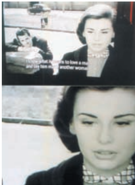
I KNOW WHAT IT MEANS TO LOVE A MAN AND SEE HIM MARRY ANOTHER WOMAN

μιούργησε ένα μικρό θόρυβο στο δισκογραφικό λόμπι. Τώρα οι μισές Ελληνίδες ερμηνεύτριες θέλουν να μεταγλωττίσουν fados και οι άλλες μισές δεν μπορούν να τα πούνε διότι πολύ down , ρε παιδί μου, δεν έχουν μέσα λίγη ζέιμπεκιά . Μαντάμ, τα fados είναι σκοτεινά λαϊκά τραγούδια για γυναίκες παρατημένες, εκδικητικές, με βαθύ πόνο, με μαχαίρι στο χέρι, με άντρα ναυτικό ή χασισέμπορα, αντρα μου ραεί. Είναι τραγούδια για γυναίκες ερωτευμένες με τυχοδιώκτες. Βαθιά θηλυκά τραγούδια. Θέλουν κόκκινο καυτό κρασί και ζεστό αίμα έτοιμο να πεταχτεί ο πίδακας. Χαμηλά φώτα, χαμηλά ταβάνια, σιωπές και πουχία μπροστά στη μοναξιά τους. Όμως οι Ελληνίδες «με σοβαρό ρεπερτόριο» είναι χαμένες στο φως του προβολέα τους. Δεν πρόκειται να μπουν στον κόπο να πονέσουν. Γιατί τώρα είναι ηρωικές και δυναμικές. Παιρνουν ανάποδες. Νευρωτικές. Αγχωμένες. «Λαϊκές». Είναι πολύ απασχολημένες προσπαθώντας να απενοχοποιήσουν το τσιφτετέλι, να βρουν συνθέτη που να τους πάει, να