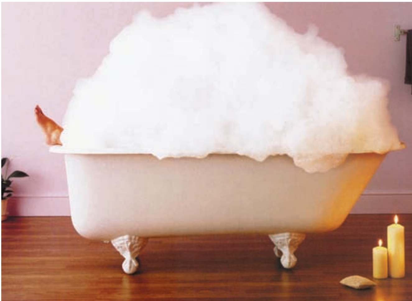
ΠΛΙΤΣ, ΠΛΑΤΣ, I WAS TAKING A BATH

Δευτέρα έκανα τεράστια άσκηση θάρρους και πήγα μόνη μου σινεμά. Αίσιος, ήταν πολύ μοναχικά, κανένα fun δεν είχε, απόρησα πώς μου ήρθε και το έκανα, ο Συγκάτοικος το έκανε αυτό συνέχεια και το θεωρούσα πάντα μεγάλη βλακεία, και την ώρα που τα σκεφτόμουν αυτά συνειδητοποίησα ότι φορούσα το μπουφάν του. ☑