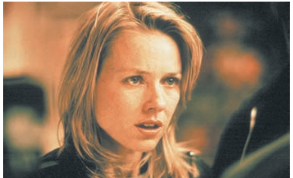
Η ΝΑΟΜΙ ΓΟΥΑΤΣ ΣΤΑ «21 ΓΡΑΜΜΑΡΙΑ»