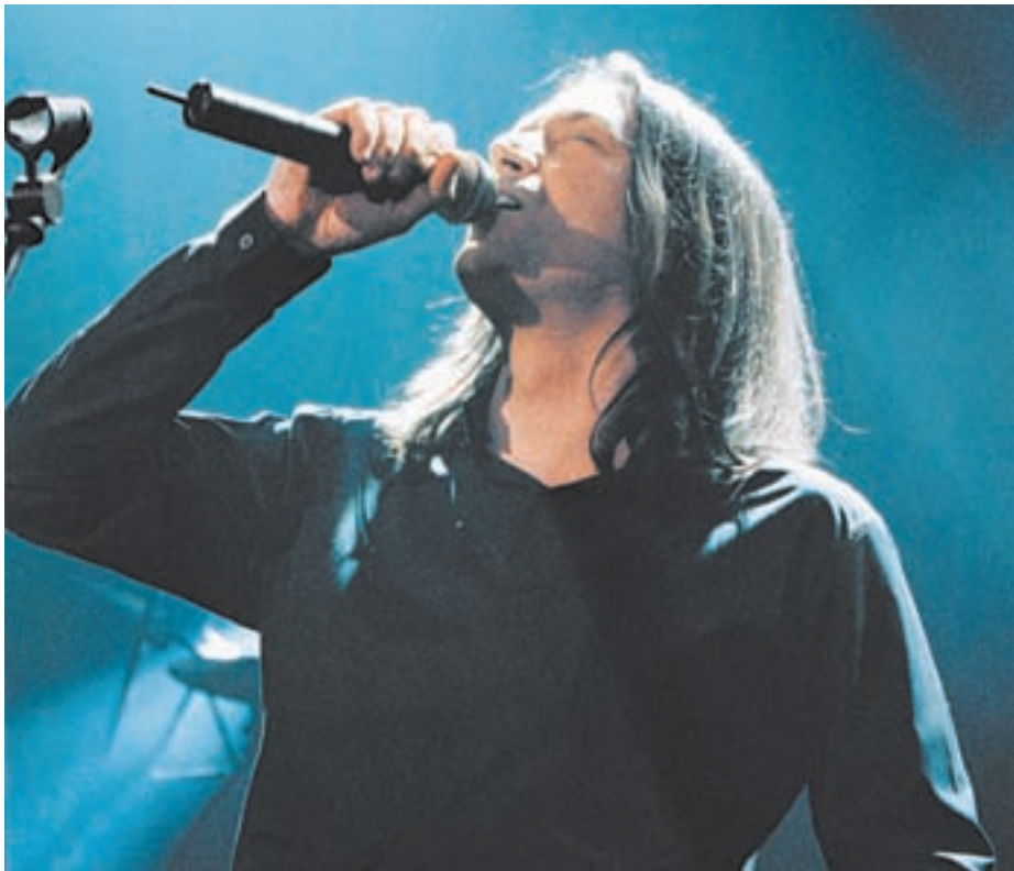
ΤΑ ΤΡΑΓΟΥΔΙΑ ΠΟΥ ΕΧΕΙ ΔΙΑΛΕΞΕΙ ΣΤΟΝ «ΒΟΤΑΝΙΚΟ» ΕΙΝΑΙ ΕΝΑ ΚΙ ΕΝΑ