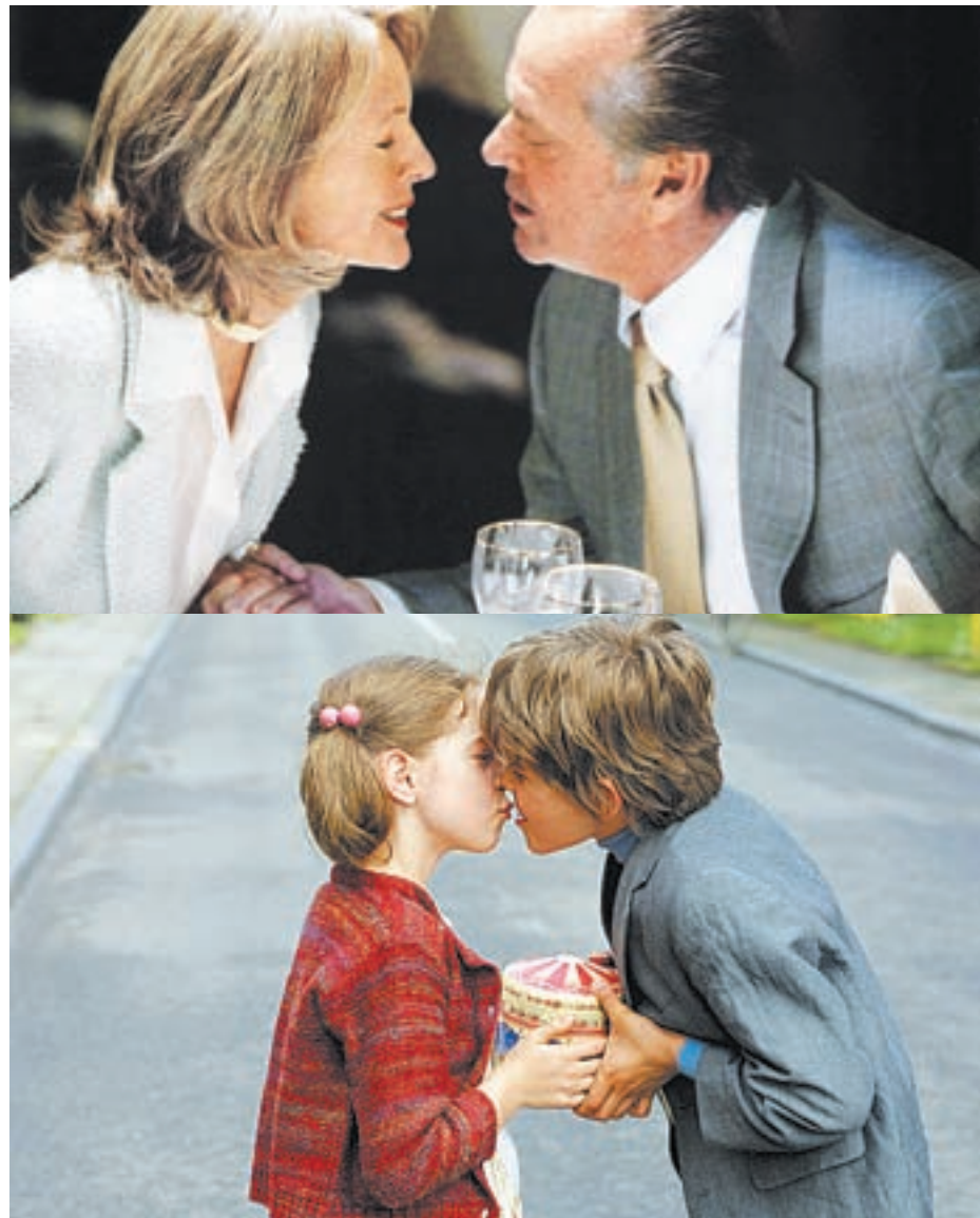
ΕΡΩΤΑΣ ΜΕ VIAGRA ΚΑΙ ΧΩΡΙΣ

Ενδιαφέρουσα παράμετρος για τις δύο ταινίες το ηλικιακό. Στο Αγάπα με παρακολουθούμε την εξέλιξη μιας φιλικής σχέσης σε αγάπη, από τα χρόνια του δημοτικού μέχρι τη γεμάτη ευθύνες αιώνια καταδίκη της ενηλικίωσης. Το φοβούνται αυτό η Σοφί και ο Ζιλιέν. Γι' αυτό και δεν σταματούν ποτέ να στοιχηματίζουν για το ποιος θα πρωτοκρατήσει το τενεκεδένιο καρουσέλ, το τρόπαιο ενός θραυτάτου παιχνιδιού που θα τους απομονώσει από το περιβάλλον του σχολείου, των φίλων και της οικογένειας. Γι' αυτό ίσως και θα τους αναγκάσει να ερωτευτούν, λες και μόνοι τους θα διαιωνίσουν αυτό το είδος. Πολύ ρομαντικό ακούγεται ως εδώ; Τότε είναι που έρχεται και το σκοτεινό συναισθημα της ερωτικής τρέλας. Το ζεύγος των ηρώων γνωρίζει το είδος της αγάπης που εξαυλώνει κάθε κοινωνική έννοια, συνήθεια και ορισμό ζωής. Ξέρουν ότι δεν είναι εύκολο να χωρέσουν σε αυτό τον κόσμο και πως δεν μπορούν να στερπηθούν ο ένας τον άλλο. Μιλάμε για κλινική περίπτωση, και ο Σαμουέλ δεν τους στρώνει τον δρόμο με