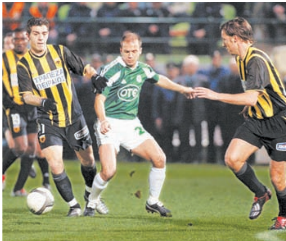
ΑΦΟΥ ΠΗΓΕΣ ΓΗΠΕΔΟ, ΚΑΛΑ ΝΑ ΠΑΘΕΙΣ...

Στην ΑΕΚ περιμένει ο Γκεβάρα 21, ο Τσε 21 και ο Φον Ρίμπεντροπ 21, αφού τον τελευταίο καιρό στα κόλπα της Original έχει μπει και ναζιστική φράζια. Εδώ δεν περιμένετε βοήθεια από την τύχη, αλλά είτε το ξέρετε είτε σας βαράνε. «Φίλε, για πες μου πώς λεγόταν το ψευ-