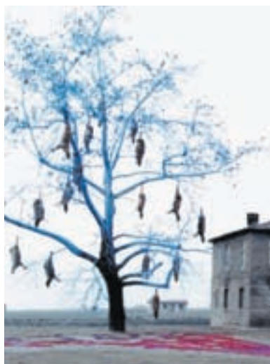
14 | Η ΠΕΡΙΠΕΤΕΙΑ ΤΟΥ ΒΛΕΜΜΑΤΟΣ

34 Athens Choices. Short list. Για όσους δεν μιλούν ελληνικά