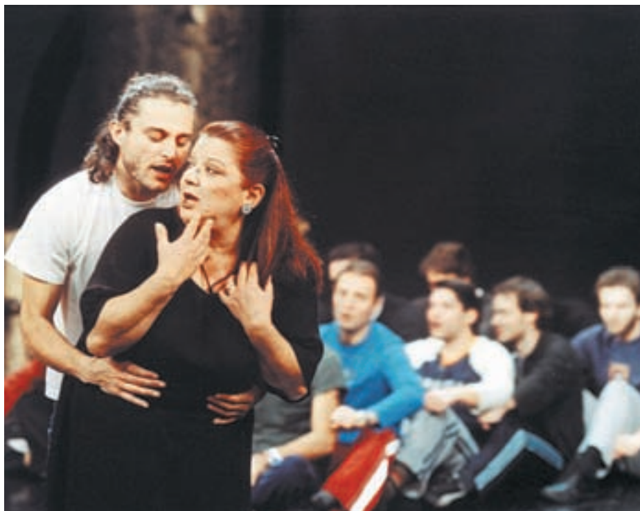
Η ΕΛΕΝΗ ΠΕΡΑΣΕ ΣΤΗΝ ΙΣΤΟΡΙΑ ΓΙΑ ΤΗ ΘΕΪΚΗ ΟΜΟΡΦΙΑ ΤΗΣ. ΤΥΧΕΡΕ ΠΑΡΗ...

Το κουδούνι χτυπάει. Βροντερή φωνή δασκάλας... «Αγαπτά μου παιδιά, σήμερα θα κάνουμε ιστορία. Όμηρικά έπη. Τρωικός πόλεμος. Ο οποίος έγινε –αν έγινε, διότι ως γνωστόν ο Όμηρος ήταν τυφλός και έγραφε ό,τι του κατέβαινε– εξαιτίας μιας γυναίκας. Της Ωραίας Ελένης. Η οποία ζούσε στη Σπάρτη με τον άντρα της βασιλιά Μενέλαο και την εξαδέλφη της Πευκίδα. Η Πευκίς ήταν ενάρετη και σεμνή, ενώ η Ελένη ήταν πανέμορφη και όλοι οι άντρες την ονειρεύονταν. Για τη θεϊκή ομορφιά της πέρασε στην ιστορία, και έτσι μέχρι σήμερα οι άνθρωποι βαφτίζουν τα παιδιά τους Ελένη. Αλλιώς θα τα ονόμαζαν Πευκίδα. Όπως Πευκίς Μενεγάκη, Πευκίς Γλύκατζη-Αρβελέρ κτλ. Τέλος πάντων, συγκεντρωθείτε για να αρχίσουμε...» Έτσι αρχίζει ένα μάθημα ιστορίας και η καινούργια μουσική παράσταση του Μιχάλη Ρέππα και του Θανάση Παπαθανασίου «Ποια Ελένη» στο Εθνικό θέατρο, στη σκηνή του Rex. Ένα μήνα πριν από την πρεμιέρα φτάνουμε για να παρακολουθήσουμε την πρόβα τους. Στις δύο ακριβώς όλοι είναι παρόντες. Οι συγγραφείς και σκηνοθέτες της παράστασης μας υποδέχονται, οι ηθοποιοί βάζουν μικρόφωνα – «όταν φοράτε μικρόφωνα, προσέξτε να μη μιλάτε», τους λέει ο Μιχάλης, είμαστε σαν «Big Brother», ο Φωκός Ευαγγελινός δείχνει στις θεές του Ολύμπου κάποια καινούργια βήματα, η Αφροδίτη Μάνου ελέγχει το πρώτο