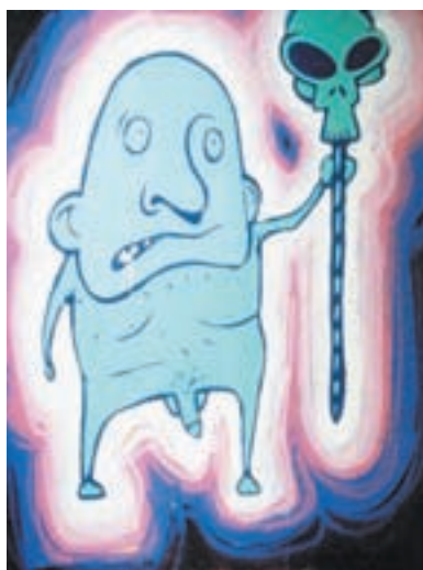
16 | ΤΑ ΠΑΙΔΙΑ ΕΙΝΑΙ OK