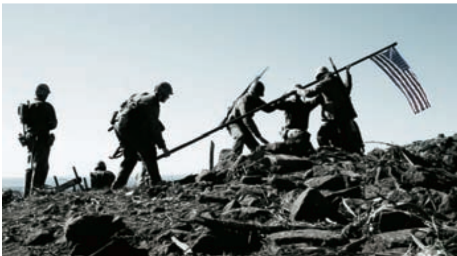
ΑΠΟ ΤΟΝ ΙΣΤΓΟΥΝΤ ΣΤΟ "BORAT" ΤΟΥ Λ. ΤΣΑΡΛΣ

Στις «Σημαίες των προγόνων μας», ο Κλιντ Ίσγουντ μας λέει πως μια εικόνα και μόνο μπορεί να κερδίσει έναν πόλεμο! Μπορεί ν' αλλάξει την πορεία της Ιστορίας, να τη διαστρεβλώσει, να διαμορφώσει συνειδήσεις, να σκλαβώσει τη λαϊκή γνώμη. Μια τέτοια φωτογραφία, έξι στρατιωτών που υψώνουν την αμερικανική σημαία στη μάχη της Ίβο Ζιμα, έγινε αφορμή να νιώσει τον ηρωισμό η οικονομικά καταπονημένη από το Δεύτερο Παγκόσμιο Πόλεμο Αμερική. Οι «ποζάτοι» επιζώντες γύρισαν άρον άρον στην πατρίδα και έγιναν το ιδανικό διαφημιστικό όχημα του Κράτους για να πουληθούν περισσότερα ομόλογα, μα η αλήθεια δεν είχε καμία σχέση με την «πραγματικότητα» της φωτογραφίας. Εκεί είναι που έρχεται να μας καταπλήξει ο