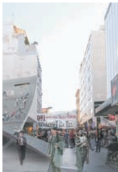
20 | ATHENS NANI