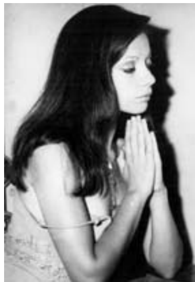
18 | ΟΙ ΖΙΓΚΟΛΟ ΤΟΥ ΠΡΩΤΟΥ