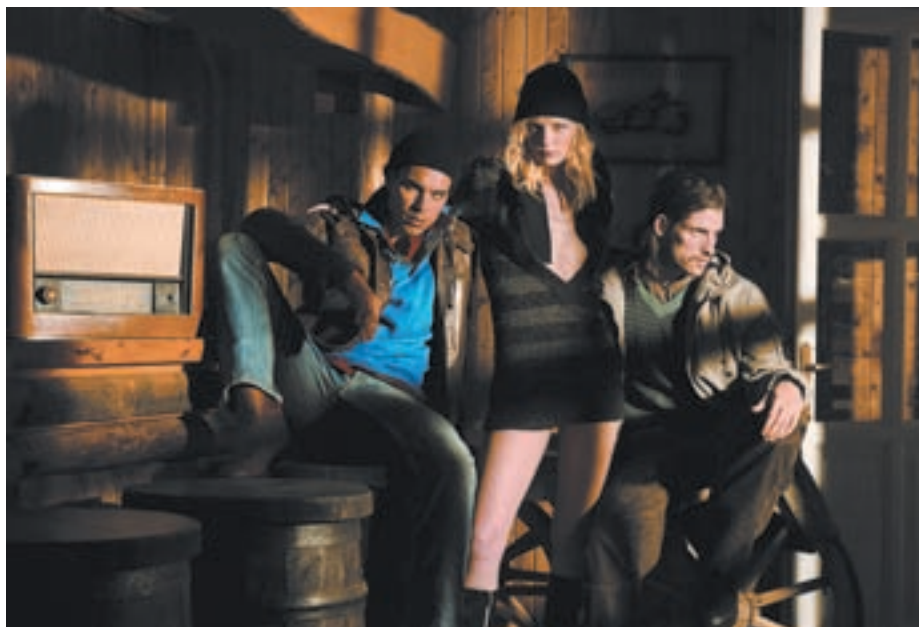
ΑΠΟ ΤΗ ΝΕΑ ΔΙΑΦΗΜΙΣΤΙΚΗ ΚΑΜΠΑΝΙΑ ΤΗΣ 3GUYS. ΠΕΡΙΣΣΟΤΕΡΕΣ ΠΛΗΡΟΦΟΡΙΕΣ ΣΤΟ WWW.3GUYS.EU

Φοράνε λοιπόν αυτή τη διάθεση, και βγαίνουν έξω αναζητώντας το καλό και το ωραίο, το οποίο δεν είναι και απαραίτητα το ακριβότερο. Οπότε, λογικό που καθόλου δεν τους ενδιαφέρουν οι στίλιστικές επιταγές. «Ποιος έχει το δικαίωμα να διατάζει κάποιον δηλαδή;» σκέφτονται, και μετά ανοίγουν την ντουλάπα και φτιάχνουν τη δική τους εμφάνιση. Τώρα, με τη δημιουργία του 3GUYS Reward Club , η παρέα πήρε και νέα γενναϊόδωρα μέλη στους κόλπους της. Το club επιβραβεύει κάθε αγορά από τα καταστήματα 3GUYS με μόνιμη έκπτωση 15% , πολλά δώρα και προνομιακές προσφορές. Μπορείς να αρχίσεις να βγαίνεις και εσύ με τα παιδιά, συμπληρώνοντας τη σχετι-