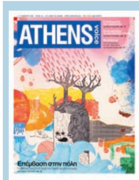
DO IT! Κάθε εβδομάδα ένας καλλιτέχνης αναλαμβάνει να σχεδιάσει το εξώφυλλο της Α.Β. Στο τέλος της χρονιάς όλα τα εικαστικά εξώφυλλα θα συγκεντρωθούν για να εκτεθούν στο Μουσείο Μπενάκη , όπου και θα είστε όλοι καλεσμένοι.

Έπειτα, μόλις σβήνουν οι προβολείς και φεύγουν οι κάμερες, μόνοι τους, αγόρια και κορίτσια μαζί, με τους φίλους τους, με κάποιους απ' την οικογένεια που νιώθουν κοντά τους, με τους λίγους μεγάλους που εμπιστεύονται, με σιγανή φωνή θα τα βάζουν πάλι κάτω, θα προσπαθούν να βγάλουν άκρη, θα καταλήγουν ότι ο έρωτας είναι δικός τους, είναι ελεύθερος, είναι για την πάρτη τους μόνο όταν συμβαίνει χωρίς εξαναγκασμό, χωρίς σκοπιμότητα, χωρίς εξουτελισμούς, χωρίς συμφέρον, χωρίς εκβιασμό, χωρίς βία. Ελπίζω. ☘