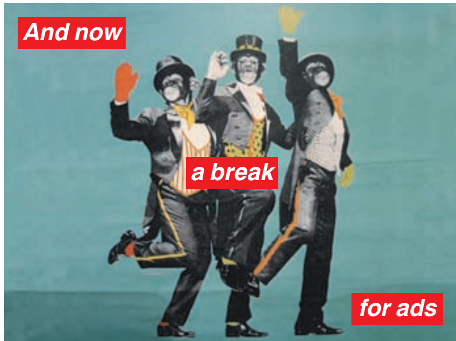
ΛΕΙΠΤΟΜΕΡΕΙΑ ΑΠΟ ΑΦΙΞΙΑ ΤΟΥ Γ. ΖΙΑΚΑ ΓΙΑ ΤΟ Κ.Θ.Ε., ΑΠΟ ΤΟ ΒΙΒΛΙΟ «ΕΛΛΗΝΙΚΕΣ ΑΦΙΞΕΙΣ», ΕΚΔ. ΚΕΔΡΟΣ