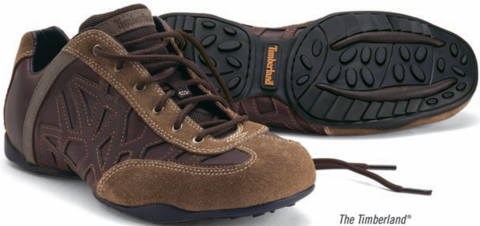
The Timberland® Mount Rainier