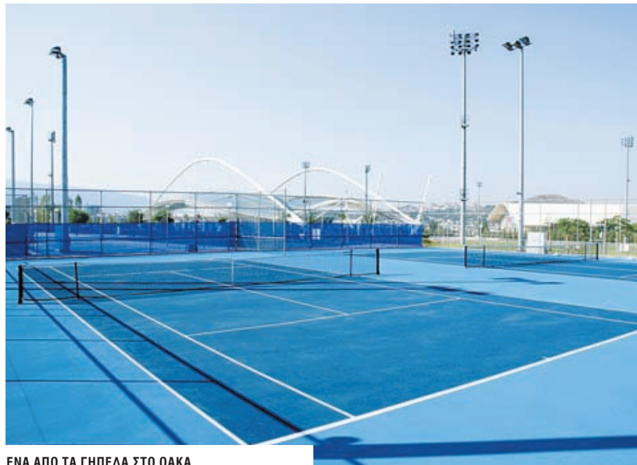
ΕΝΑ ΑΠΟ ΤΑ ΓΗΠΕΔΑ ΣΤΟ ΟΑΚΑ

Πληροφορίες για το πρόγραμμα των αγώνων 210 6834.562-63. Η είσοδος είναι ελεύθερη.