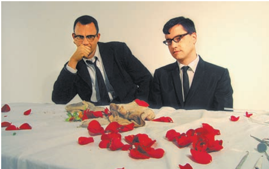
MATMOS. ΕΡΩΤΑΣ, ΤΡΙΑΝΤΑΦΥΛΛΑ, ΑΓΕΛΑΔΑ, ERUS

● Το « The Rose Has Teeth In The Mouth Of A Beast » είναι η πινακοθήκη δέκα μνημειακών gay προσωπικοτήτων που θαυμάζουν οι Matmos. Για την ακρίβεια δέκα εκκεντρικών «freaks που η σεξουαλικότητά τους ήταν ένα μέρος μόνο του πάρτι...». Παρά την κατακερματισμένη τακτική τους το άλμπουμ είναι μία προσλωμένη, συγκινητική αναφορά στο κάθε ένα από αυτά τα δέκα πρόσωπα που, τελικά, ήρθαν στο πάρτι –μαζί και με τους πολύ ιδιαίτερους καλεσμένους που συμμετέχουν στην πχογράφηση, μία guest list με πρόσωπα-κλειδιά της εναλλακτικής μουσικής σκηνής από τη Δυτική Ακτή μέχρι τη Νορβηγία. Οι Matmos βυθίστηκαν στον κόσμο και την περσόνα του κάθε ιστορικού «πορτρέτου», μεγέθυναν τους ήχους, τις λεπτομέρειες και το στίλ του καθένα και το αναπαρήγαγαν με απολαυστική φαντασία σε ένα υπέροχο συμπαγές κολλάζ ηχητικών επινοήσεων επάνω στον Έξυπνο Χορευτικό Ρυθμό (για όσους ενδιαφέρονται, η νέα ονομασία του είναι intricatronica ). 1. Roses and Teeth for Ludwig Wittgenstein: Μία παράγραφος από το κείμενο «Φιλοσοφικές Αναζητήσεις» του Wittgenstein επάνω στο παιχνίδι της γλώσσας και της σχέσης με τον πόνο, που απαγγέλλουν μεταξύ άλλων η Γαλλίδα performer Laetitia Sonami (γνωστή για τα ηλεκτρικά ηχητικά γυναικεία γάντια που κατασκευάζει), ο Γερμανός Marcus Schmickler (μέλος της πειραματικής σκηνής της Κολωνίας) και η καταλυτική φωνή της Bjork. Μία μακρινή ανάμνηση της Laurie Anderson καθώς η ρυθμική βάση του κομματιού σχηματι-