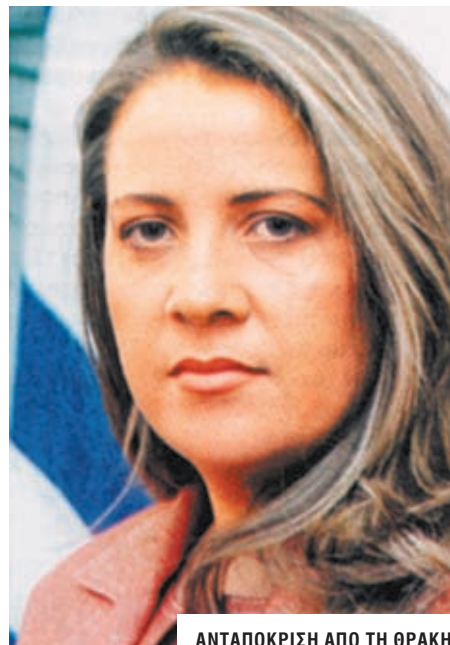
ΑΝΤΑΠΟΚΡΙΣΗ ΑΠΟ ΤΗ ΘΡΑΚΗ

Του ΣΤΕΦΑΝΟΥ ΤΣΙΤΣΟΠΟΥΛΟΥ (stefanostitsopoulos@yahoo.gr)