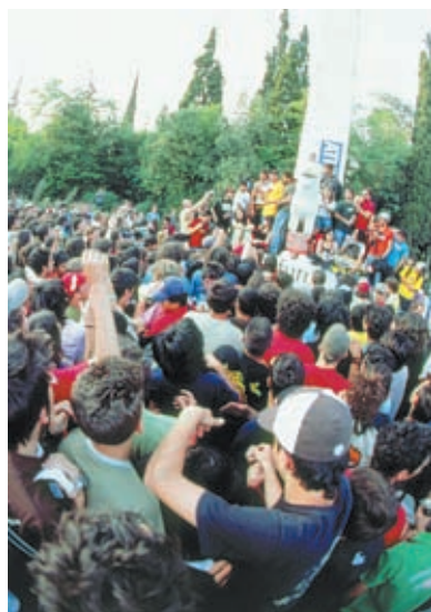
20 | SKATEBOARDING IN ATHENS