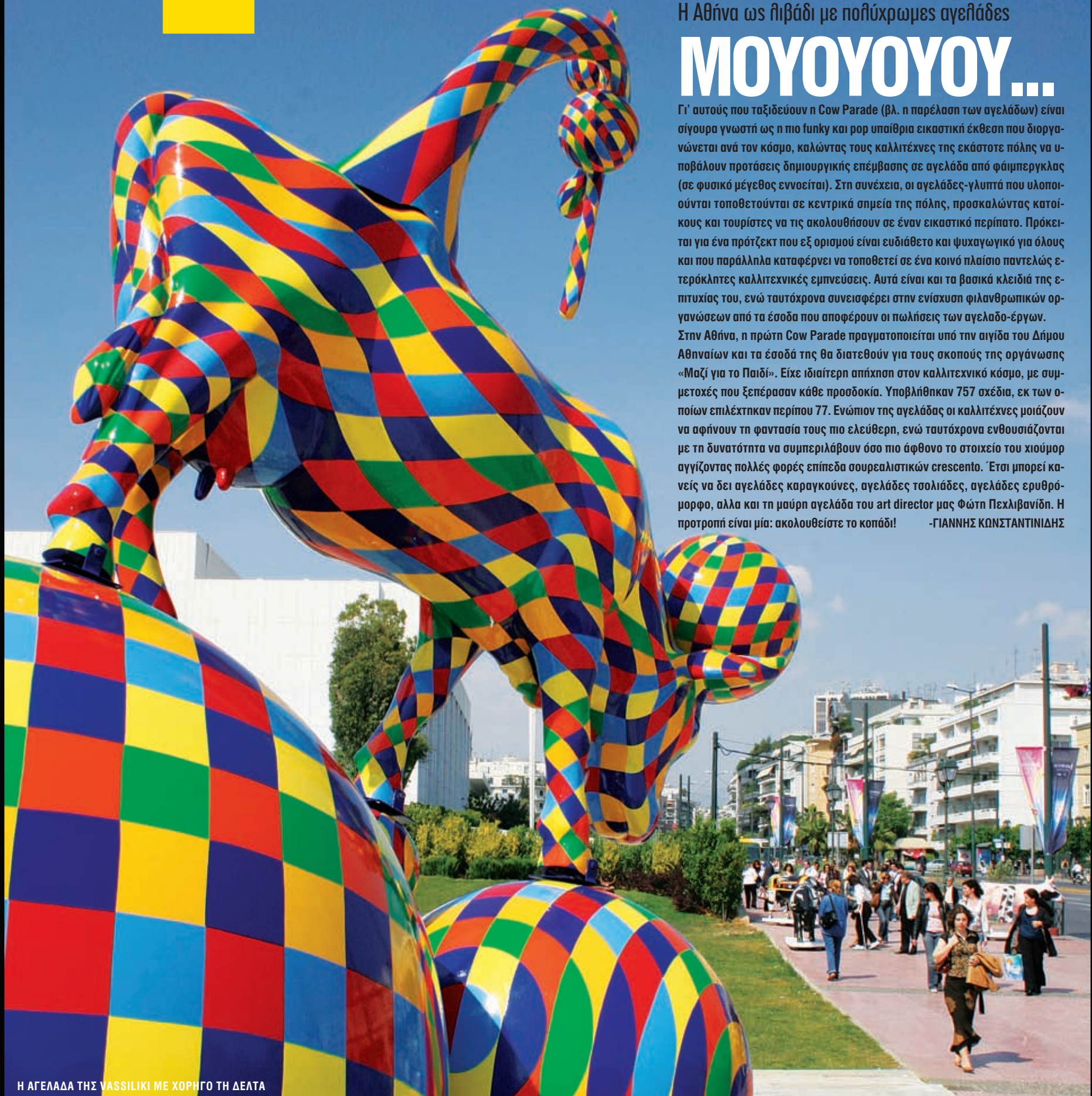
Η ΑΓΕΛΑΔΑ ΤΗΣ VASSILIKI ΜΕ ΧΟΡΗΓΟ ΤΗ ΔΕΛΤΑ