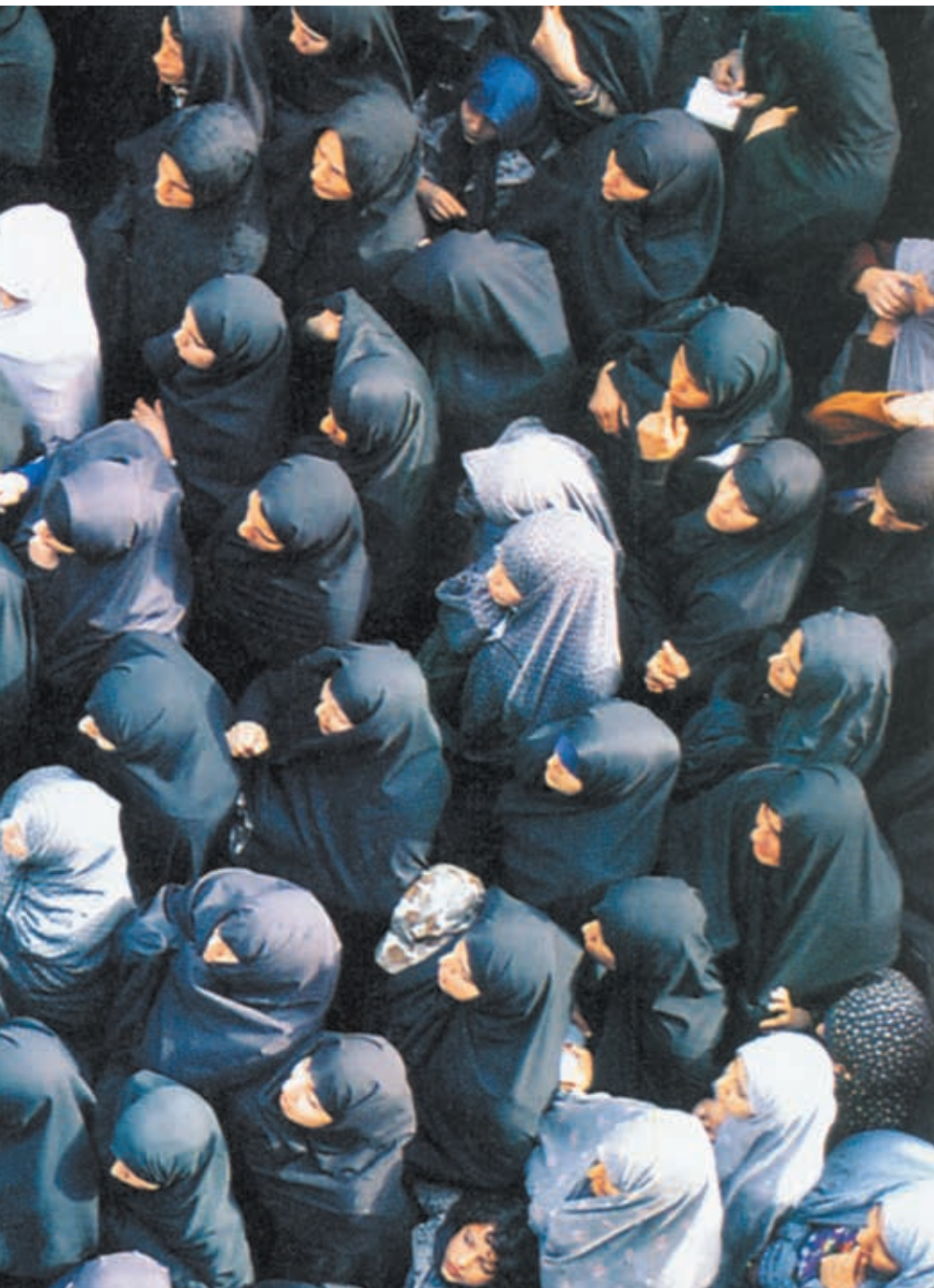
που αφορά την Εκκλησία και περισσότερο ένα θέμα κοινωνικής ένταξης