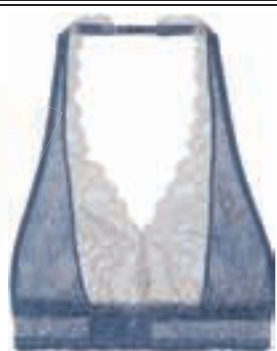
INTIMISSIMI Εσώρουχο-τοπ από δαντέλα