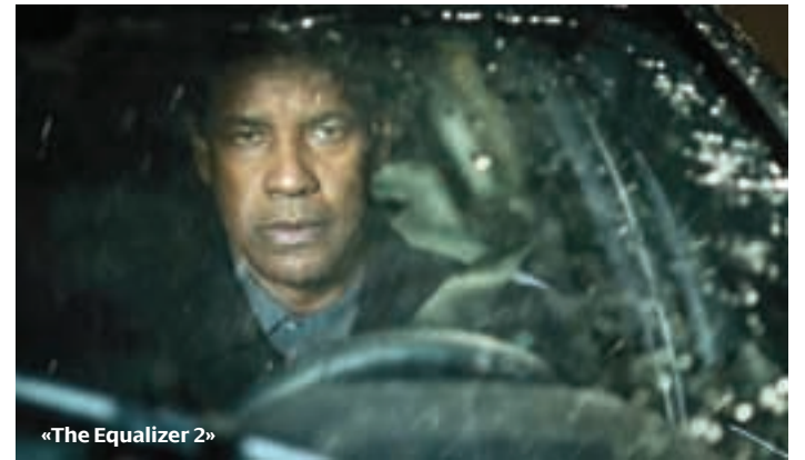
«The Equalizer 2»

☛ Φεστιβαλικός οργανισμός (Παζολίνι, Δράμα, Νύχτες Πρεμιέρας)