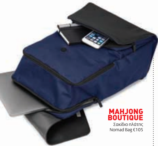
MAHJONG BOUTIQUE Σακίδιο πλάτης Nomad Bag €105