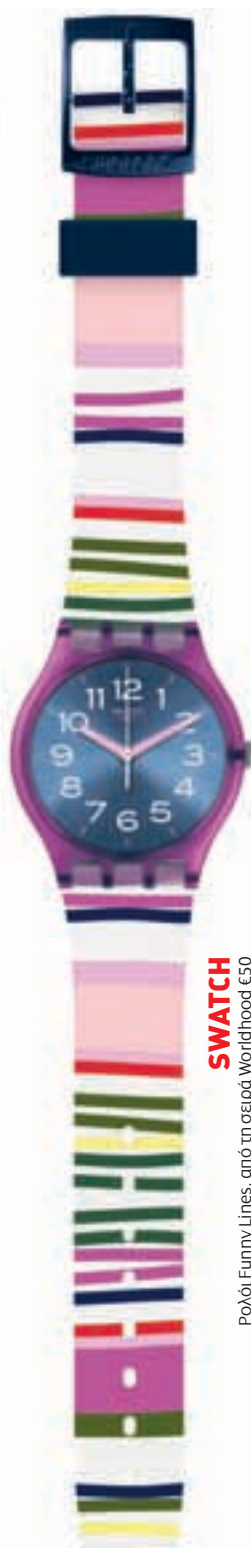
SWATCH Ρολόι Funny Lines, από τη σειρά Worldhood €50