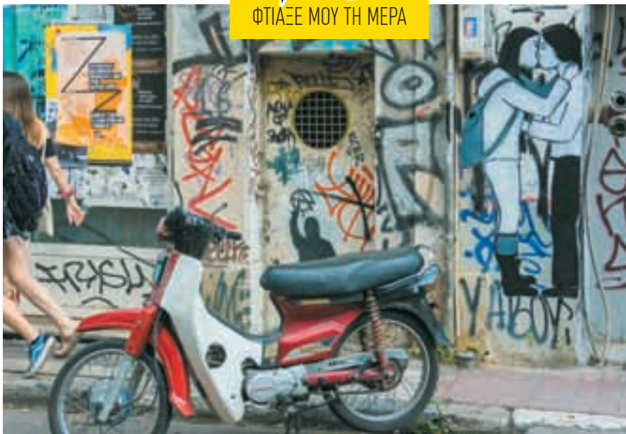
Έρωτας στα Εξάρχεια