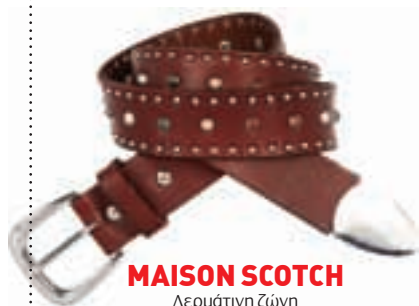
MAISON SCOTCH Δερμάτινη ζώνη