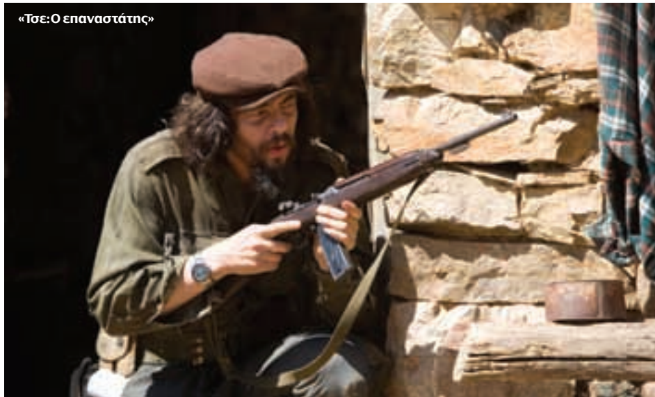
«Τσε: Ο επαναστάτης»

* ΑΔΙΑΦΟΡΗ ** ΜΕΤΡΙΑ *** ΚΑΛΗ **** ΠΟΛΥ ΚΑΛΗ ***** ΕΞΑΙΡΕΤΙΚΗ