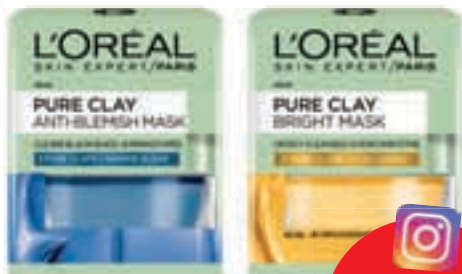
L'ORÉAL PARIS Μάσκες προσώπου €10/τεμ.

Ακολουθήστε το LOOKmag στο Instagram και δεσπόζεις να τις κερδίσεις!