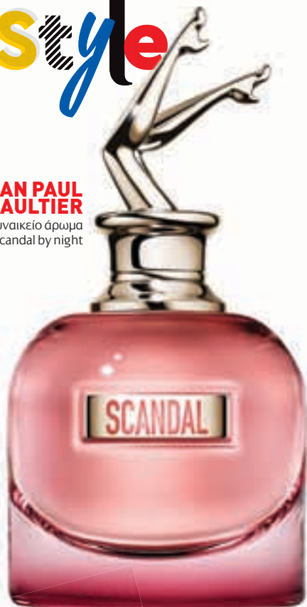
JEAN PAUL GAULTIER Γυναικείο άρωμα Scandal by night