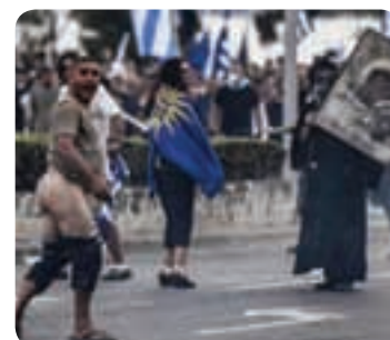
Ξεβράκωτος της Θεσσαλονίκης