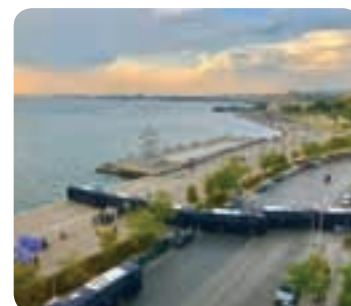
Οδόφραγμα (με κλούβες)

φυίας είναι η ικανότητα να εκμεταλλεύεσαι κάποιο αντικείμενο καθημερινής χρήσης για μια τελείως διαφορετική χρήση.