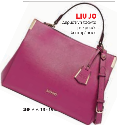
LIU JO Δερμάτινη τσάντα με χρυσές λεπτομέρειες